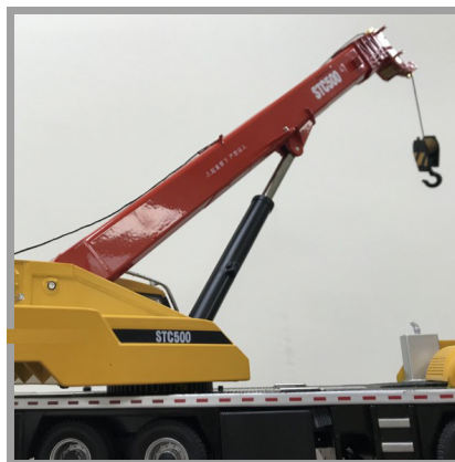
磁力式-皮帶輸送機・起重機・粉碎機