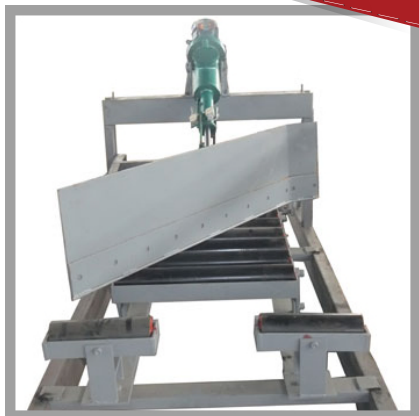
非接觸型-檢測輸送皮帶超速・打滑